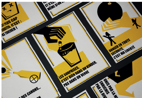
AFFICHES PRÉSENTENT LORS DES ÉVÈNEMENTS Conception par Inès Bernedo, Bac pro AMA CVPM

Un engagement en faveur de la lutte contre les violences sexistes et sexuelles