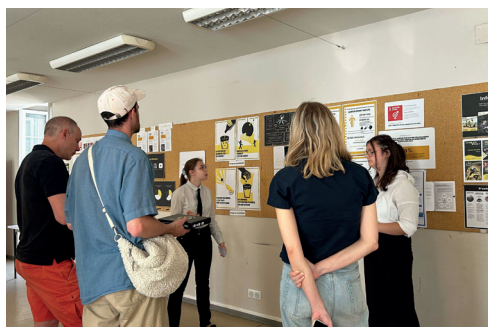
SCÉNOGRAPHIE DE DIPLÔME Mise en scène et déroulement par ordre chronologique