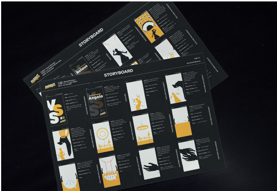
APERÇU DES STORYBOARDS Réalisé par Bérénice Delahaye, DNMADE Numérique