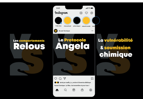
VIDÉOS PRÉSENTENT SUR LES RÉSEAUX SOCIAUX

En tant que storyboarder et motion designer, nous avons apporté une prolongation de la campagne d'affichage disponible au Sismographe réalisé par Inès Bernedo, en Bac pro CVPM au lycée Saint-Géraud. Ce projet a pour vocation d'amplifier la portée des messages et venir apporter les informations manquantes concernant à la mise en place du protocole Angela.