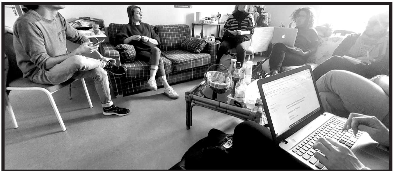
Reunion avec les bénévoles du planning familial d'Aurillac

Le but de ce projet a été de représenter des personnes de la communauté LGBTQI+ à travers leur histoire, leurs difficultés et leurs joies. Les témoignages sont de histoires vraies, qui ont été récoltées puis illustrées de la manière la plus lisible possible. La composition, le style, le trait et les couleurs ont également été étudiés afin de créer une histoire émouvante et humaine.