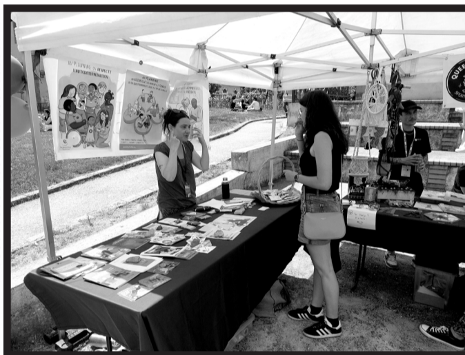
Stand du planning familial durant la marche des fiertés 2025