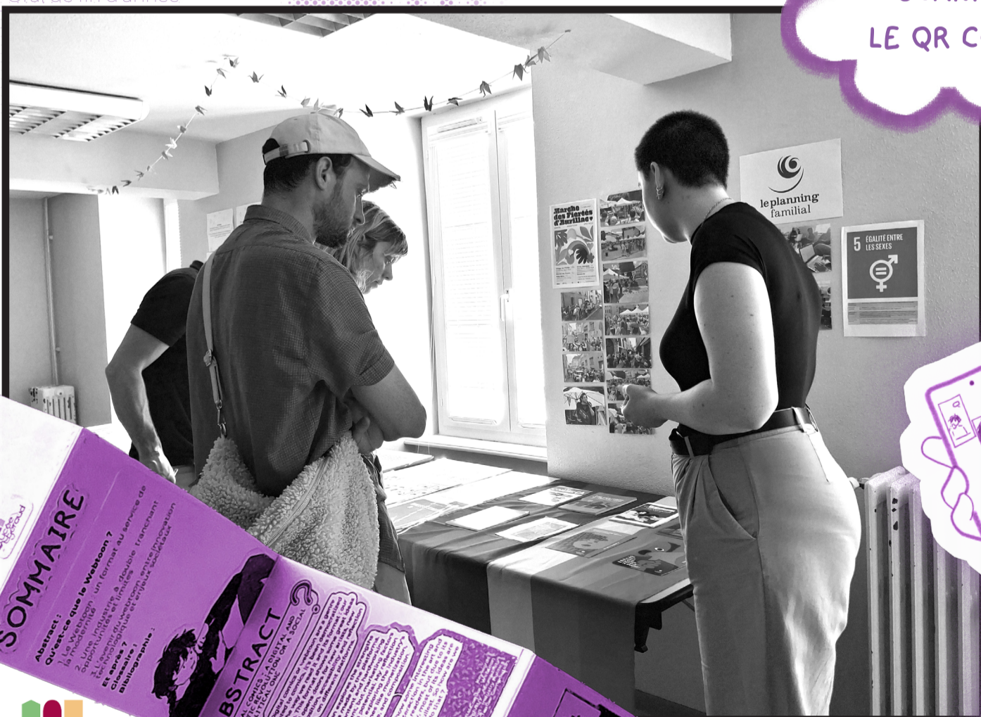
Mémoire sur le webtoon